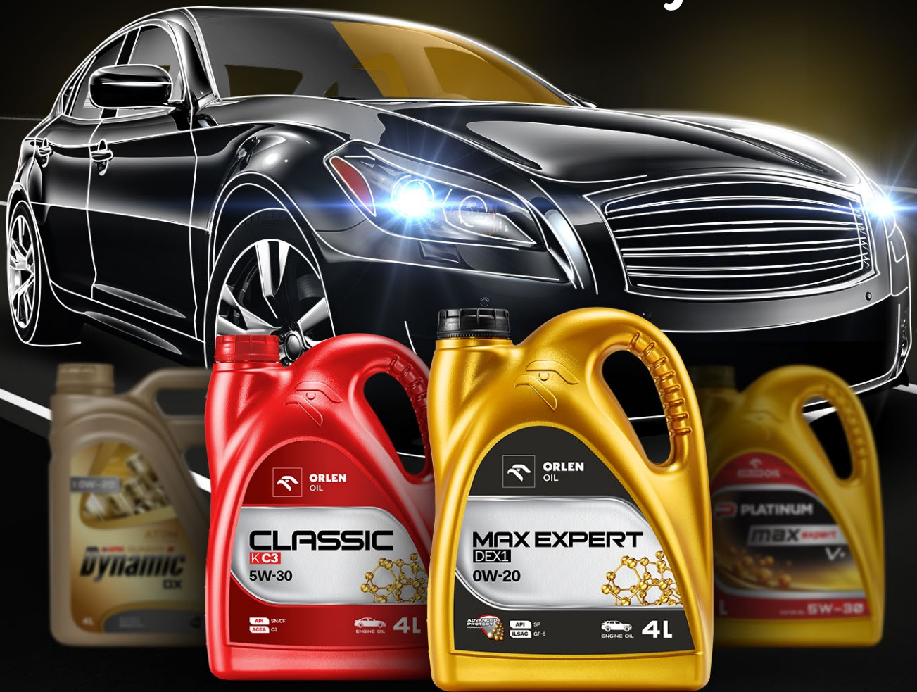
TABELA ZAMIENNIKÓW SAMOCHODY OSOBOWE

Poznaj nową ofertę ORLEN OIL dla samochodów osobowych